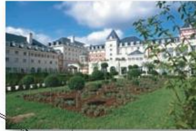
PARC HOTELIER DU VAL DE FRANCE