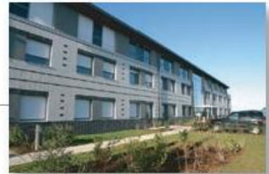
Magny le Hongre Parc tertiaire de 5 hectares. 50 entreprises, 400 emplois