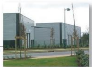
Bailly-Romainvilliers Parc d'activités de 10 hectares. 1200 m 2 réservés à l'accueil de jeunes entreprises...