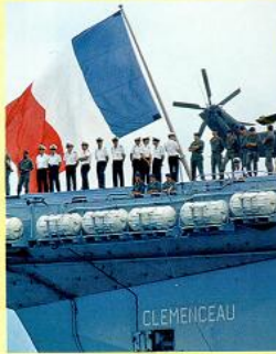
Des marins sur le porte-avions Clemenceau.

L'Outre-mer donne à la France une présence mondiale et satisfait sa volonté de rester une puissance politique de premier rang. De nombreux détachements militaires stationnent dans ces territoires et contrôlent les grandes routes maritimes [...]. De même, ils assurent le contrôle du Centre spatial guyanais à partir duquel sont lancées les fusées Ariane. Ce patrimoine permet aussi à la France d'être [...] la troisième puissance maritime mondiale avec 10 millions de km 2 d'étendues océaniques à sa disposition [...] pour l'exploitation des hydrocarbures 1 [...], la recherche scientifique maritime, la protection et la préservation de l'environnement marin, et la pêche.