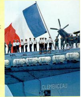
Des marins sur le porte-avions Clemenceau.

L'Outre-mer donne à la France une présence mondiale et satisfait sa volonté de rester une puissance politique de premier rang. De nombreux détachements militaires stationnent dans ces territoires et contrôlent les grandes routes maritimes [...]. De même, ils assurent le contrôle du Centre spatial guyanais à partir duquel sont lancées les fusées Ariane. Ce patrimoine permet aussi à la France d'être [...] la troisième puissance maritime mondiale avec 10 millions de km 2 d'étendues océaniques à sa disposition [...] pour l'exploitation des hydrocarbures 1 [...], la recherche scientifique maritime, la protection et la préservation de l'environnement marin, et la pêche.