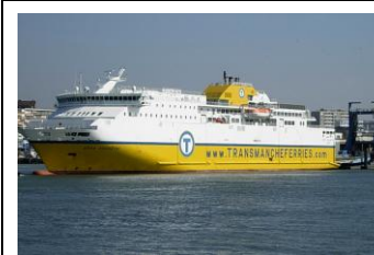
Vrac liquide : le pétrole